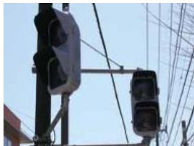
③ 極端な気象現象によるインフラ等の機能停止のリスク