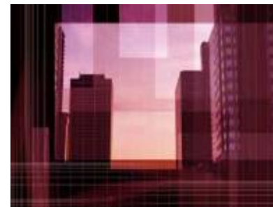
④ 熱波による、特に都市部の脆弱な層における死亡や疾病のリスク