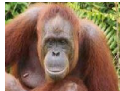
⑧ 陸域及び内水生態系がもたらすサービスの損失リスク