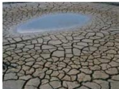
⑥ 水資源不足と農業生産減少による農村部の生計及び所得損失のリスク