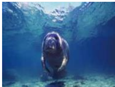
⑦ 沿岸海域における生計に重要な海洋生態系の損失リスク