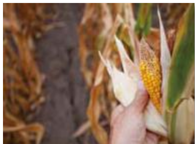
⑤ 気温上昇、干ばつ等による食料安全保障が脅かされるリスク