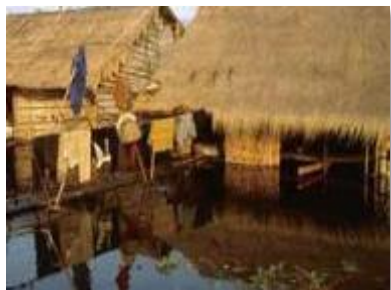
① 海面上昇、沿岸での高潮被害などによるリスク