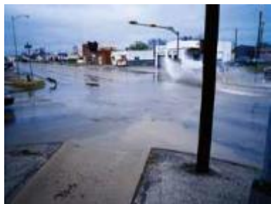
② 大都市部への洪水による被害のリスク